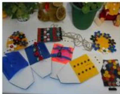
Зона развития мелкой моторики