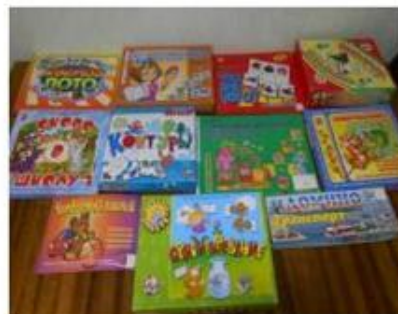
Зона дидактического сопровождения